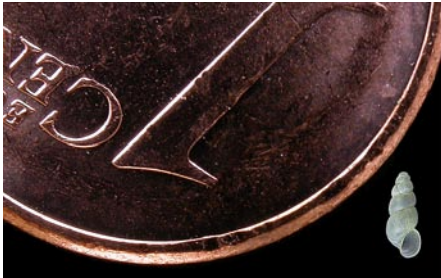
Die Gehäuseshöhe von Bythiospeum husmanni beträgt nur ca. 2 mm.

Mit der Wahl der nördlichsten Brunnenschnecke Deutschlands – Husmanns Brunnenschnecke aus dem flussbegleitenden Grundwasserstrom der Ruhr in Nordrhein-Westfalen – zum Weichtier des Jahres 2009 möchte das Kuratorium die neuesten Forschungsergebnisse zu dieser Art, aber auch den bestehenden Forschungsbedarf für die gesamte Gruppe, herausstellen. Mit dieser winzigen Schnecke soll stellvertretend auf die wenig bekannte Lebewelt des in seiner Ausdehnung riesigen – heute zunehmend bedrohten – unterirdischen Lebensraums im Grundwasser der Fluss-Schotter und des Karsts und dessen spektakuläre Erforschung aufmerksam gemacht werden. Heute weiß man beispielsweise, dass Bythiospeum husmanni nur in extrem sauberem und gleichmäßig kühlem Grundwasser überleben kann. Somit kann das Vorkommen der Art gewissermaßen als Indikator für die Unbedenklichkeit des Grundwassers zur Trinkwasserversorgung gewertet werden.