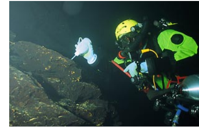
Aufsummeln von lebenden Brunnenschnecken in der Wulfbachquellhöhle in Mühlheim/Donau

Brunnenschnecken kennt man aus Frankreich, Deutschland, den Niederlanden, der Schweiz, Österreich, Ungarn, Slowenien und Norditalien. Für die Vertreter dieser in der Differenzierung der Arten noch sehr unerforschten Gattung stehen allein in Deutschland über 50 wissenschaftliche Namen zur Verfügung. Auch wenn sich in zukünftigen Untersuchungen ein größerer Teil dieser Namen als Synonyme erweisen sollte, besitzt Deutschland mit Sicherheit die höchste Diversität an Brunnenschnecken.