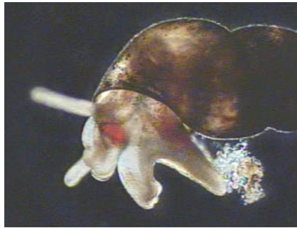
Bythiospeum husmanni aus dem Wasserwerk Echthausen. Auf dem Operculum siedeln koloniebildende Einzeller.

Bythiospeum husmanni erhielt seinen Namen 1963 durch den Braunschweiger Zoologieprofessor CÄSAR RUDOLF BOETTGER. Die lebend gesammelten Exemplare stammten damals aus einem Siebbrunnen in der Ruhr-Aue bei Schwerte, südöstlich von Dortmund. Zur Beschreibung