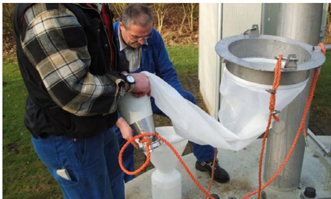
Herausziehen von Husmanns Brunnenschnecke Bythiospeum husmanni aus einem Brunnen der Wassergewinnung des Werks Echthausen.

Brunnenschnecken kennt man aus Frankreich, Deutschland, den Niederlanden, der Schweiz, Österreich, Ungarn, Slowenien und Norditalien. Für die Vertreter dieser in der Differenzierung der Arten noch sehr unerforschten Gattung stehen allein in Deutschland über 50 wissenschaftliche Namen zur Verfügung. Auch wenn sich in zukünftigen Untersuchungen ein größerer Teil dieser Namen als Synonyme erweisen sollte, besitzt Deutschland mit Sicherheit die höchste Diversität an Brunnenschnecken.